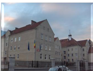
Ștefan Sfarghiu – absolvent 2007

Multă baftă tuturor celor care vor să urmeze calea militară !