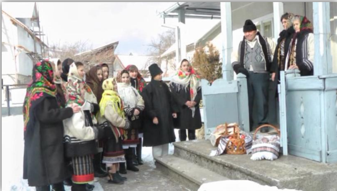
” Sus, la poarta Raiului...” – Foto: Bianca Tudose (cl. a VII-a A)